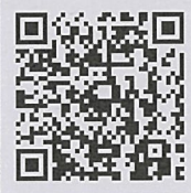
《お申込みフォーム》