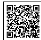
《お申込みフォーム》