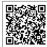
《お申込みフォーム》

URL http://www.mcci.or.jp/ E-mail gakuin@po.mcci.or.jp