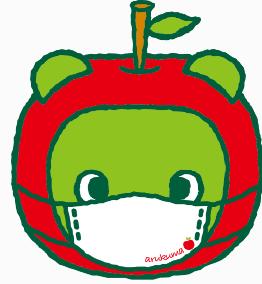
長野県PRキャラクター 「アルクマ」 ©長野県アルクマ