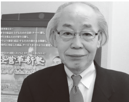
株式会社タイム 代表取締役