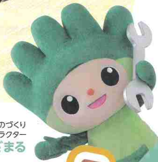
長野県ものづくり 人材育成応援キャラクター わざまる