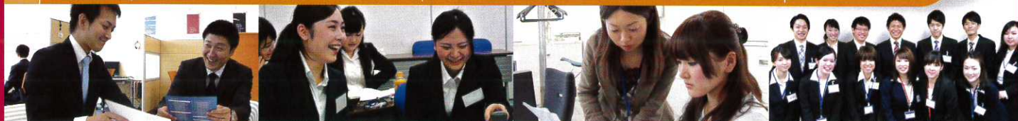
マッチング(面接・試験)